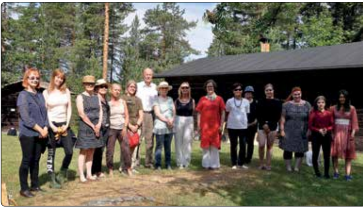
Ensimmäinen leiri juhannuksen jälkeen sai nauttia kauniista ilmasta

Riikka Lenkkeri Kuvataiteilija ja leiriohjaaja