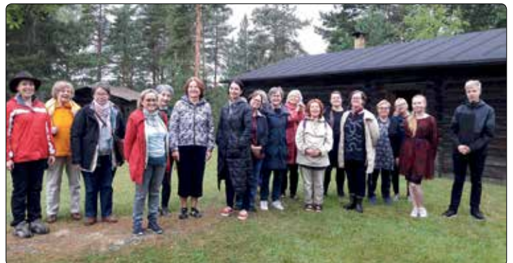
Toinen leiri viikkoa myöhemmin koki sateen ihmeen